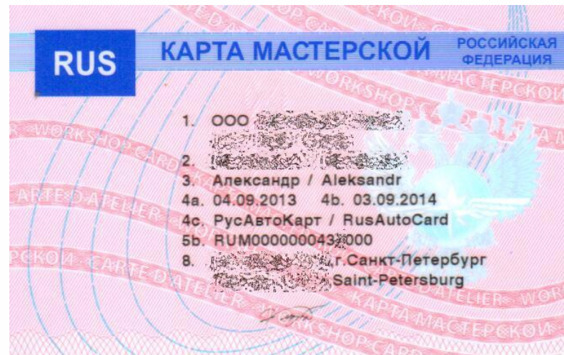
Для тахографа ЕСТР