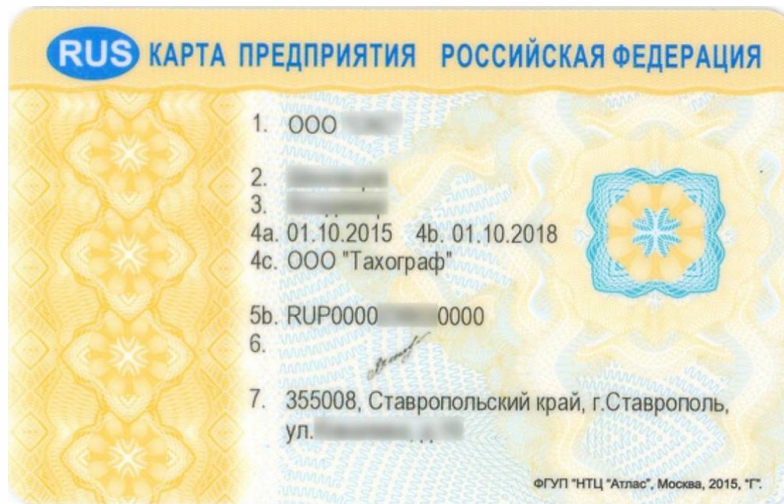
Для тахографа с блоком СКЗИ