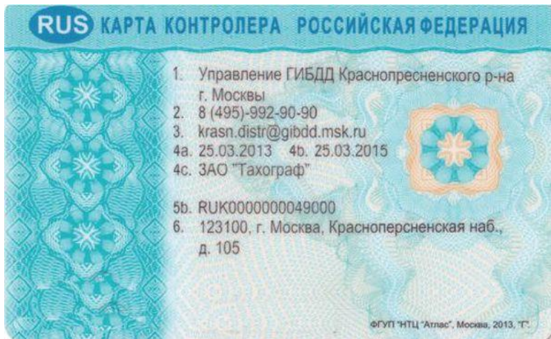
Для тахографа с блоком СКЗИ