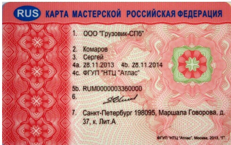
Для тахографа с блоком СКЗИ